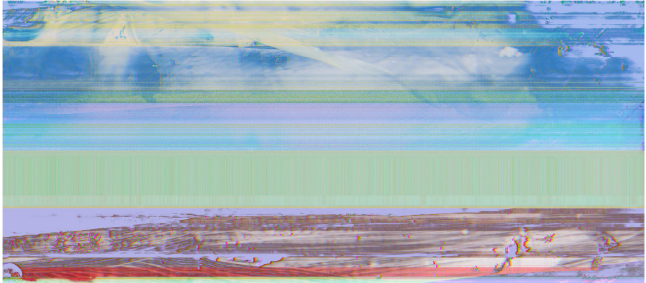
Sky-Chiffre 1 Digitale Collage, Light Jet High End Photography auf Aludibond, 88x200cm